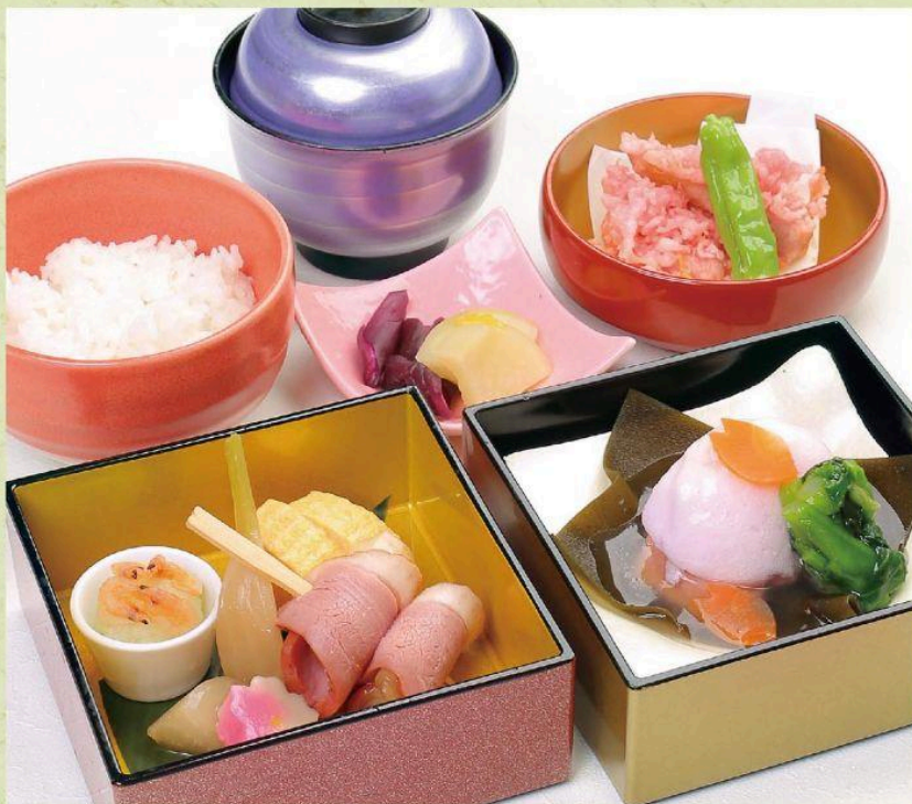
季節の和膳 ¥1,650 (税込)