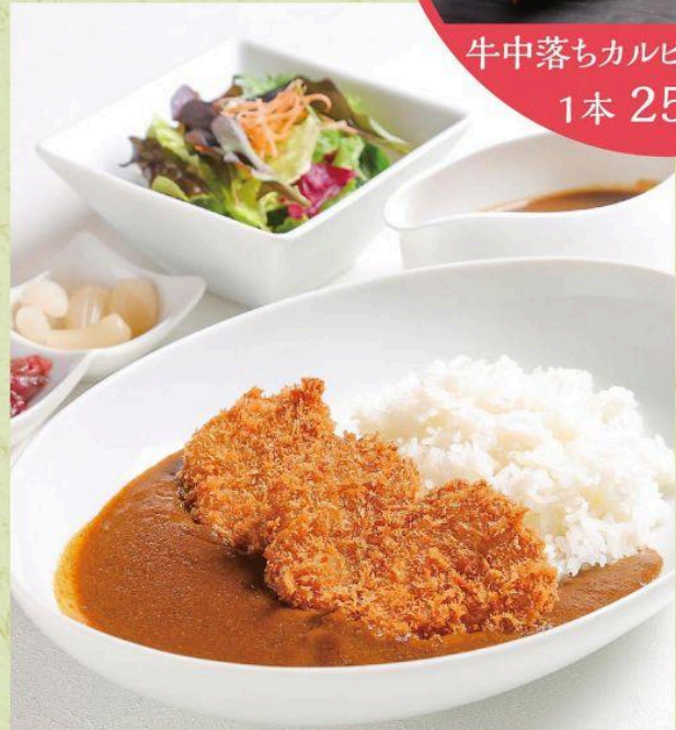
ヒレカツカレー ¥1,870 (税込)