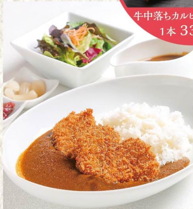
ヒレカツカレー ¥1,870 (税込)